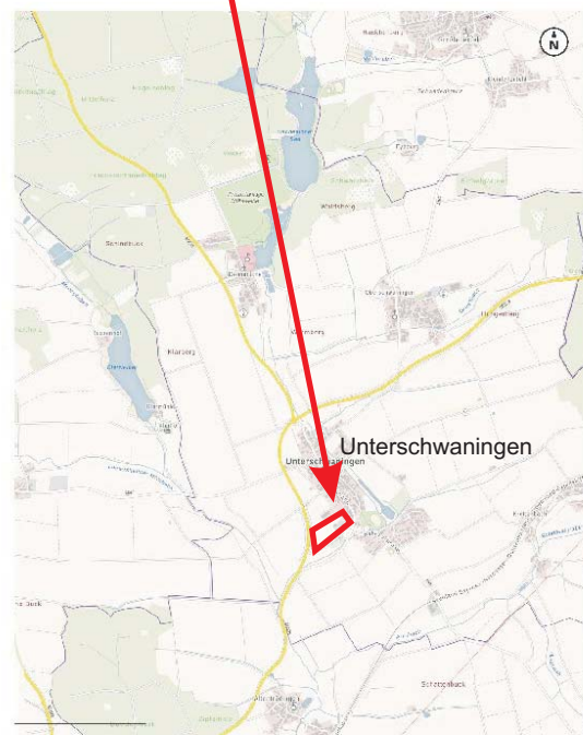
(III) Lage des Gewerbegebietes in Unterschwaningen