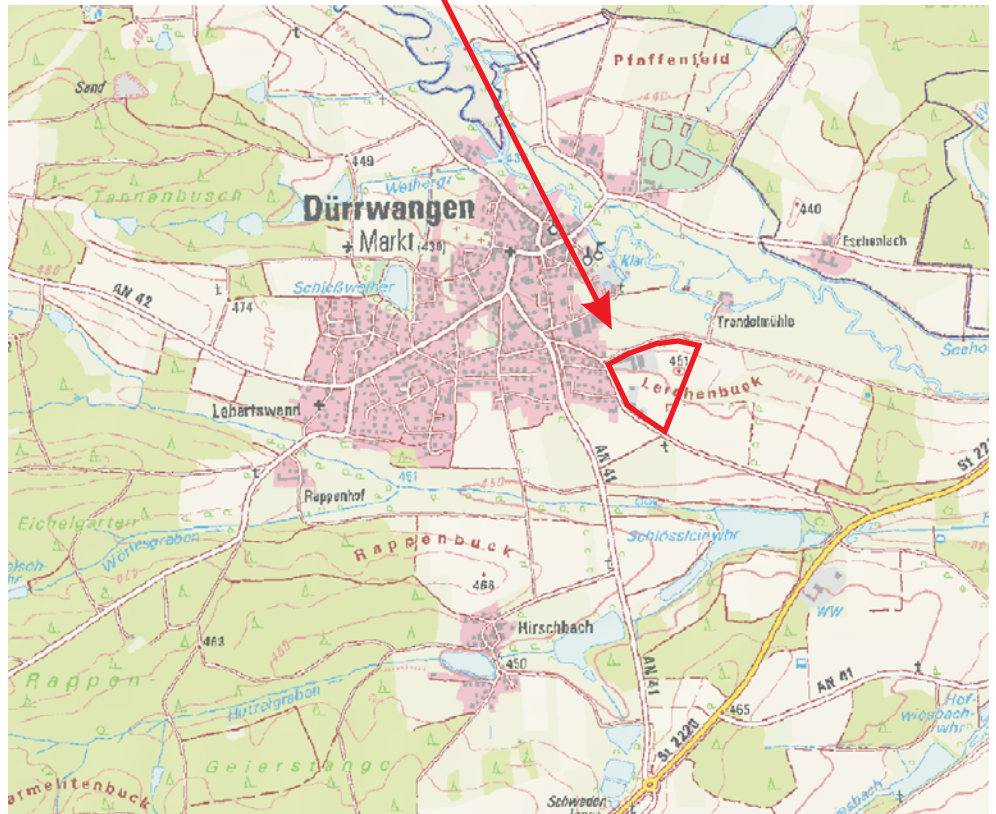
(III) Lage des Gewerbegebietes in Dürrwangen