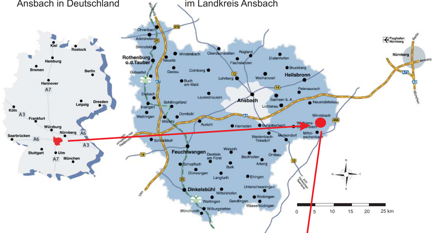
(II) Lage der Stadt Windsbach im Landkreis Ansbach

Lage: Gewerbegebiet "Fohlenhof", 7 km zur Autobahn A6, Ausfahrt Neundettelsau Gewerbegebiet "Hergersbach" unmittelbar an der Bundesstraße B 466