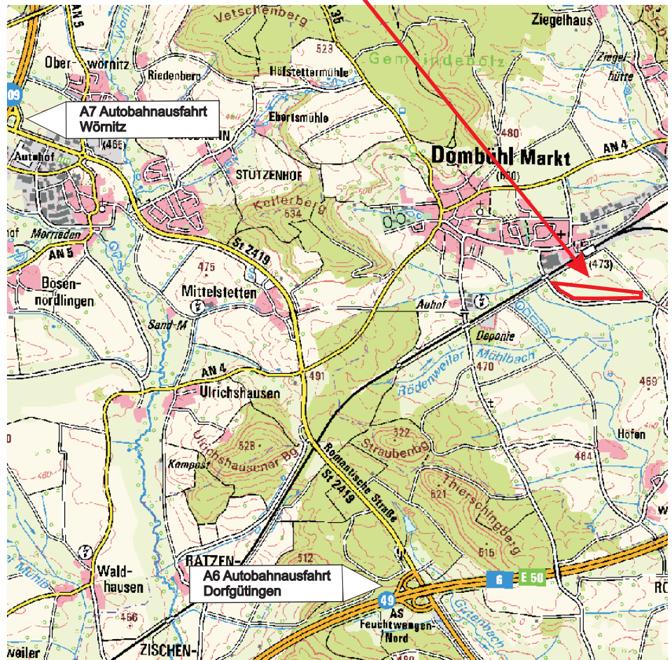
(III) Lage des Industrie- und Gewerbegebietes Dombühl-Süd